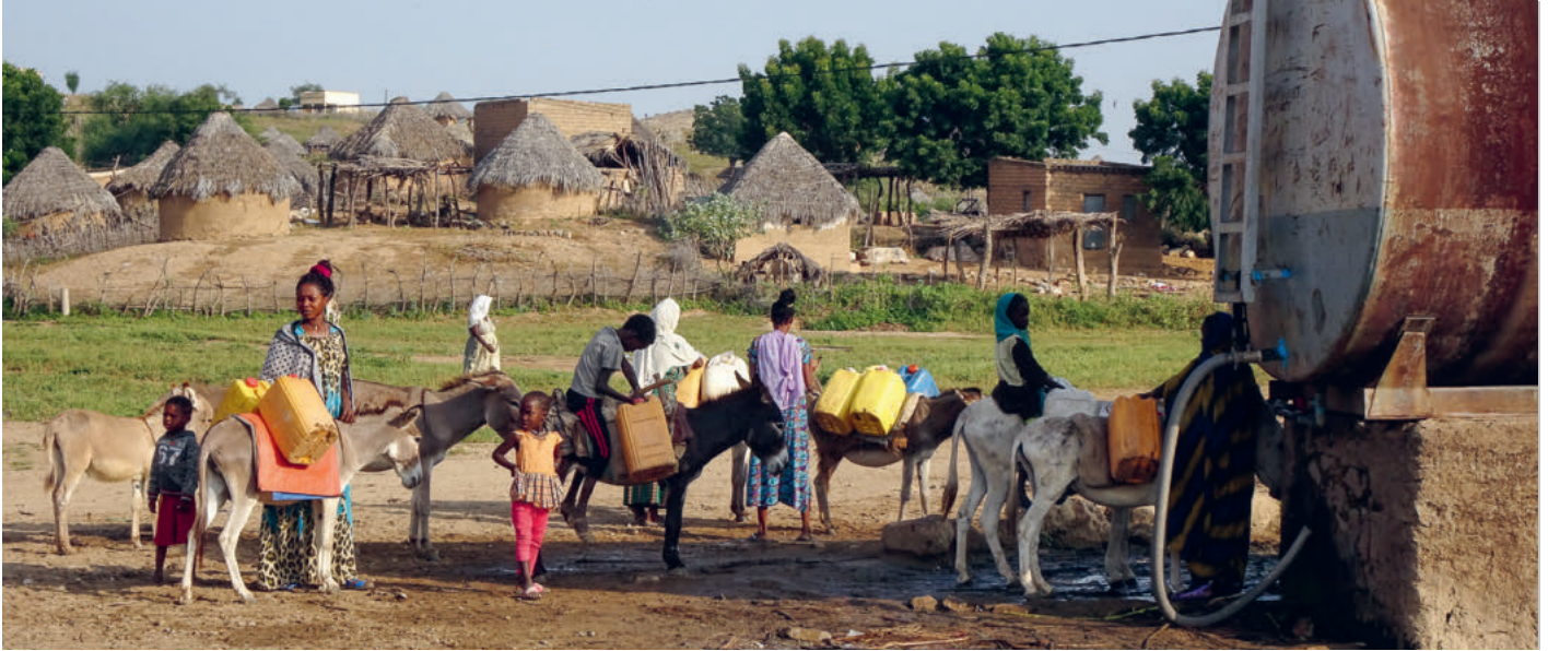
Früh am Morgen geht es zum Wasserholen. Esel leisten den Frauen dabei wertvolle Hilfe

Früh am Morgen herrscht an den zwei Wasserstellen in Tokombia Hochbetrieb. Dort treffen wir auch einige Frauen, die in den vergangenen Monaten durch SUKE-Spenden eine Eselin erhalten haben. Und hautnah erleben wir an einer Wasserstelle auch, welche große Hilfe und Erleichterung die vierbeinigen Helfer ihren Besitzerinnen bedeuten.