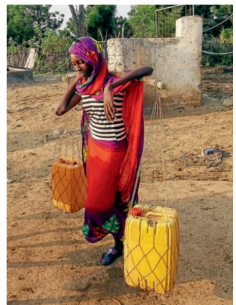
Wer keinen Esel hat, muss die schwere Last selbst tragen