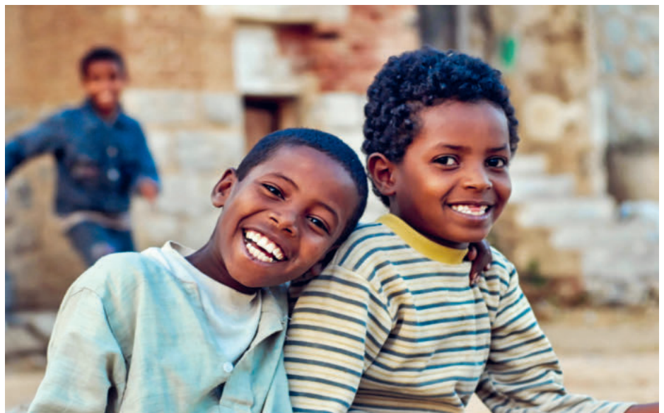
Keep smiling: Fröhliche Kinder freuen sich in Keren auf das Fest.

Kalender A4 für Franken 17.-, Kalender A3 für Franken 25.- zuzüglich Porto.