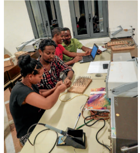
Bei der Elektrikerausbildung werden Schaltungen gebaut und experimentiert

wirklich keinen Sinn, ein Bildungsprojekt nach zwei Jahren abzubrechen – das wäre bei allen bisherigen Erfolgen nicht nachhaltig! Ich bin mir im Klaren, dass der Entscheid der DEZA nicht fachliche, sondern politische Hintergründe haben wird. Denn auf der fachlichen Ebene gaben uns die beiden Evaluationen, die dieses Jahr durchgeführt wurden, sehr gute Noten. Nein, es wird ein grundsätzlicher Entscheid sein, ob die Schweiz überhaupt mit Eritrea eine engere Zusammenarbeit eingehen will. Da gibt mir aber das Treffen von Bundesrat Ignazio Cassis mit dem eritreischen Aussenminister Osman Saleh am Rande der UNO-Generalversammlung etwas Hoffnung und wir bereiten uns jedenfalls Mal auf eine Fortsetzung vor.