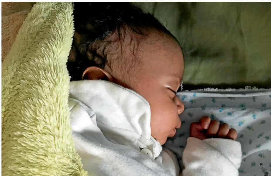
Ein kleiner Mensch hofft auf unsere Hilfe

Nebenstehendes Bild zeigt eines davon, in eine warme Decke gehüllt. Warum geben Mütter ihre neugeborenen Kinder weg? Die Antwort ist nicht einfach. Sicher ist nur, dass die Mutter sich in einer extremen psychischen Notsituation befinden muss - nicht anders als jene Mütter, die in der Schweiz ihre Säuglinge zum Beispiel im „Babyfenster“ abgeben. Das gibt es in Eritrea nicht. Dort legen die Mütter ihre Kinder vor dem Waisenaus oder vor Kirchen ab - also an Orten, wo sie sich sicher sind, dass das Kind gefunden und ins Heim gebracht wird. Unsere Hilfe kon-